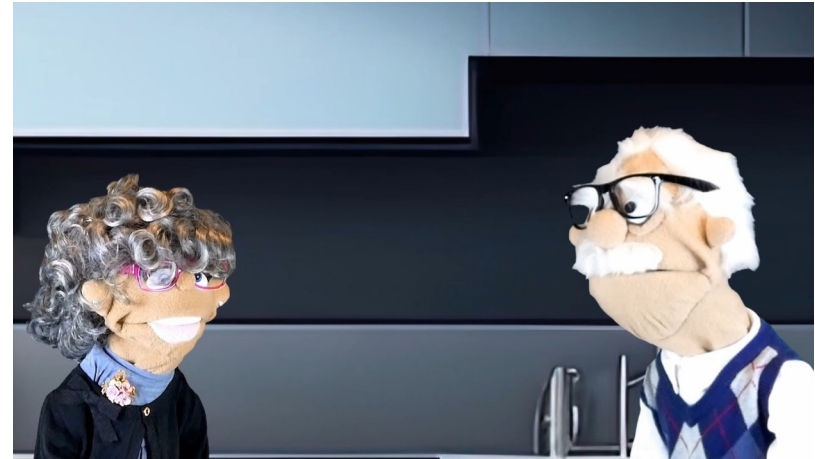
Rabuffi no entiende lo que está pasando